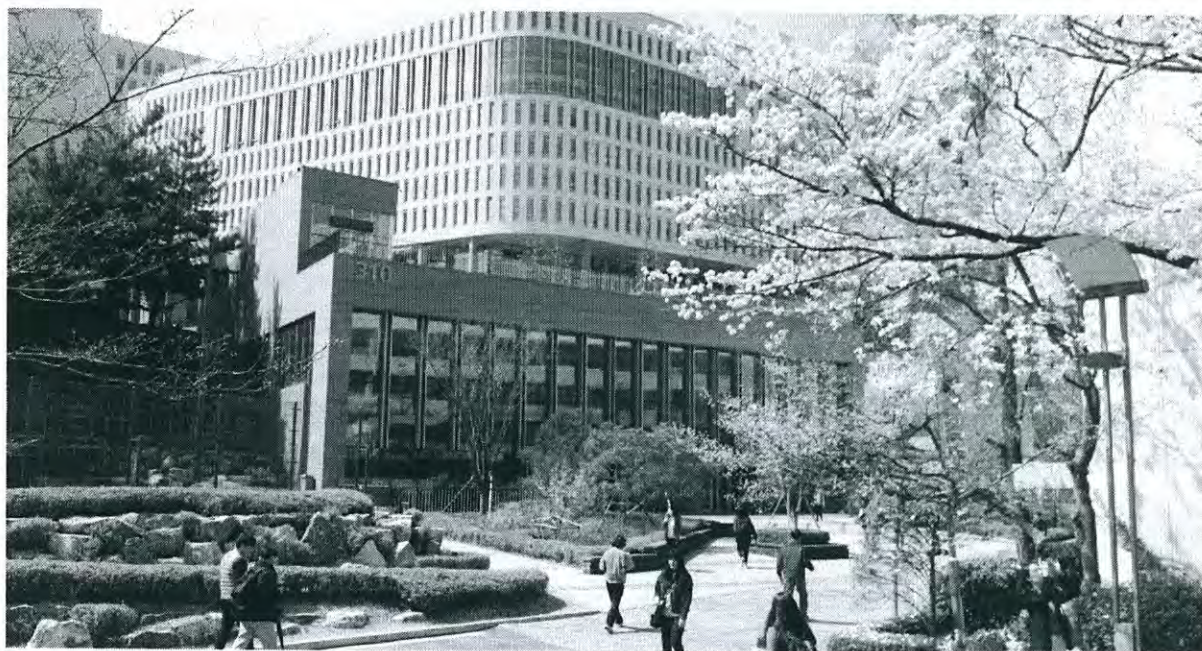
Centennial Building (Bldg. #310)